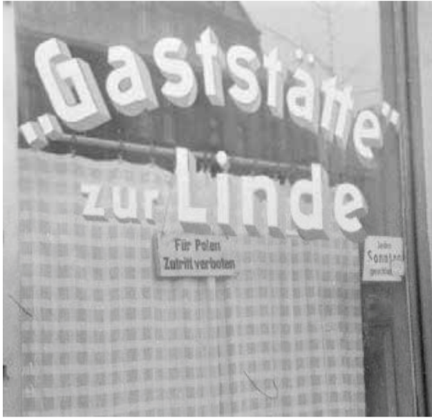
Надпись на здании кафе в польском городе Гнезен: «Полякам вход воспрещен»

О чём это они? О военном ущербе, который, по их утверждению, был нанесен республике со стороны СССР во время Второй мировой войны?