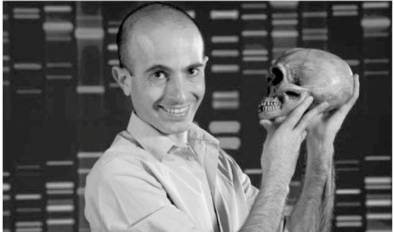
Юваль Ной Харари.

«Вы не сможете спрятаться ни от Amazon, ни от Alibaba, ни от тайной полиции. Пока вы работаете в Интернете, смотрите видео или